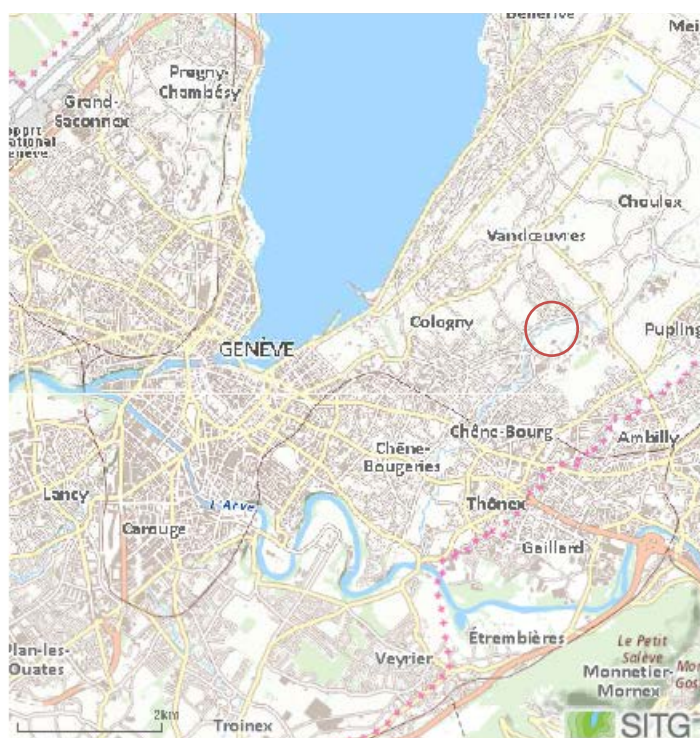
Fig. 1: Extrait de carte du canton de Genève, localisation du projet

La rivière est bordée de propriétés privées en rive droite et de parcelles agricoles (privées Etat de Genève) en rive gauche et d'un cordon boisé.